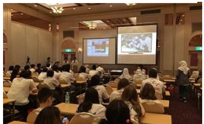
「防災世界子ども会議 2016in 新潟」 Web 会議を通しての神戸市立葺合高校の発表

世界と学び合う「国際協働学習」を実践できるネット上の学びの場です。このコラボレーションセンターに入り、協働学習のしくみをマスターして、対話・発表・提案などをします。