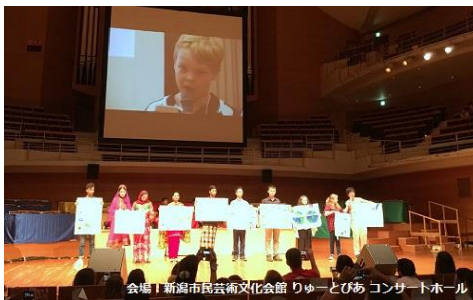
会場 | 新潟市民芸術文化会館 りゅーとびあ コンサートホール

この胸の内にある情熱の炎を燃やして、 私たち学生は責任を果たしていきます。 世界の未来は私たちにかかっているのですから